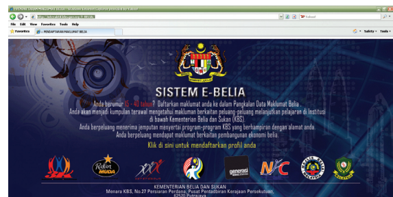
Rajah 1: Laman Sistem e-Belia

Kewujudan e-Belia dapat memudahkan pihak KBS dan agensi yang berkaitan mengenalpasti kumpulan sasaran untuk menjayakan dasar, program dan aktiviti pembangunan belia. e-Belia juga mewujudkan satu jaringan perkongsian maklumat yang dapat memberi manfaat kepada semua pihak di samping dapat memperkukuhkan sistem penyampaian maklumat dan memperluaskan capaian maklumat program-program yang dianjurkan oleh pihak KBS dan golongan belia di seluruh negara.