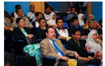
Liputan sekitar Persidangan Meja Bulat