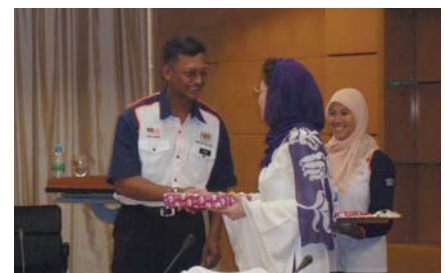
▪ Gambar-gambar di sekitar 'Luncheon Talk'.

Di antara saranan untuk menangani beberapa permasalahan yang berkaitan dengan isu ini adalah: kaum dewasa haruslah menjadi contoh teladan yang baik, peranan media massa adalah untuk mempromosi kesetiaan di dalam ikatan perkahwinan, monogami harus diberi keutamaan dan poligami sebagai langkah terakhir, keluarga yang mengalami permasalahan dan disfungsi haruslah mendapatkan khidmat kaunseling dan penceraian sebagai jalan yang terakhir bagi penyelesaian masalah dalam sesuatu perkahwinan kerana impaknya terhadap anak-anak. Terdapat beberapa inisiatif untuk mewujudkan indeks yang mengukur kedudukan wanita, yang akan dapat dimanfaatkan dari segi perancangan program, strategi serta penstrukturan dan pelaksanaan polisi kerana kaum wanita adalah sebahagian besar daripada aset modal insan negara.