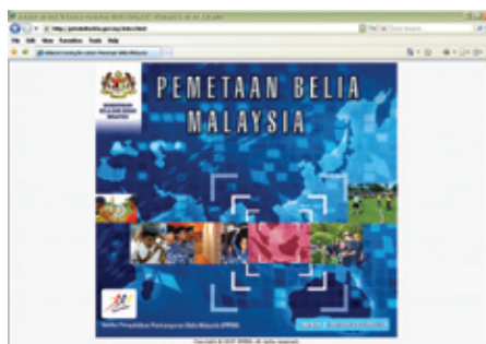
Laman Utama Portal Pemetaan Belia Malaysia

Buku ini mengandungi sebanyak 35 jenis peta yang dikategorikan mengikut kumpulan data tertentu. Menyedari maklumat ini perlu diakses oleh semua pihak, Portal Pemetaan Belia Malaysia telah dibangunkan dan boleh dicapai melalui url http://petabelia.kbs.gov.my . Portal ini memuatkan 126 peta yang dibentuk berdasarkan data-data semasa yang diperoleh daripada agensi-agensi kerajaan dan badan-badan bukan kerajaan.